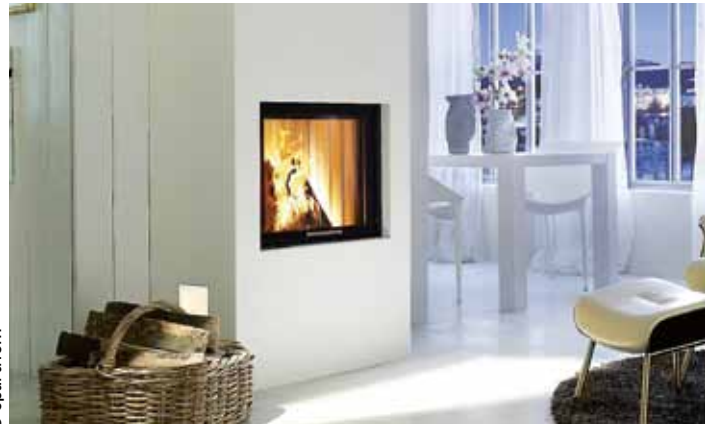
Poêle à granulés Bellavista, Thermorossi.