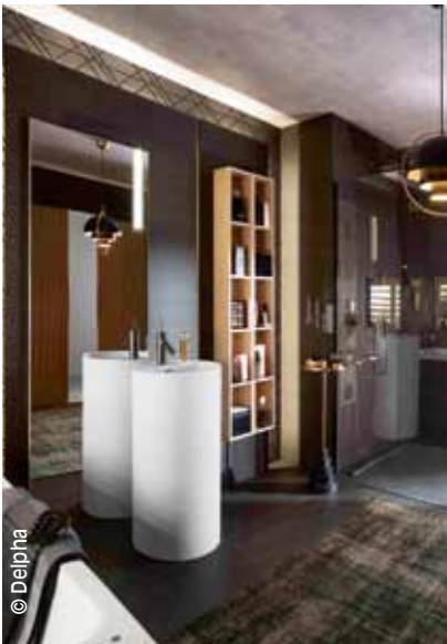
Colonne-vasque dans la collection tendance « Black », chez Delpha.

« Les rénovations de salle de bains sont aujourd'hui motivées par des raisons qui varient considérablement d'une génération à l'autre », déclare Nino Sitchinava, économiste chez Houzz.