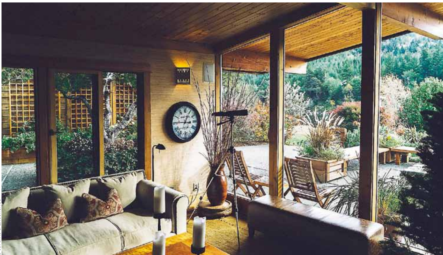
La serre véranda revient au goût du jour et permet une véritable immersion dans son jardin même en hiver tout en étant à l'intérieur.